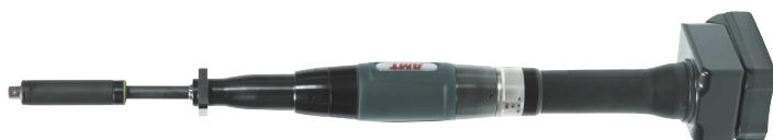
Wkrętarka prosta HSXSBW